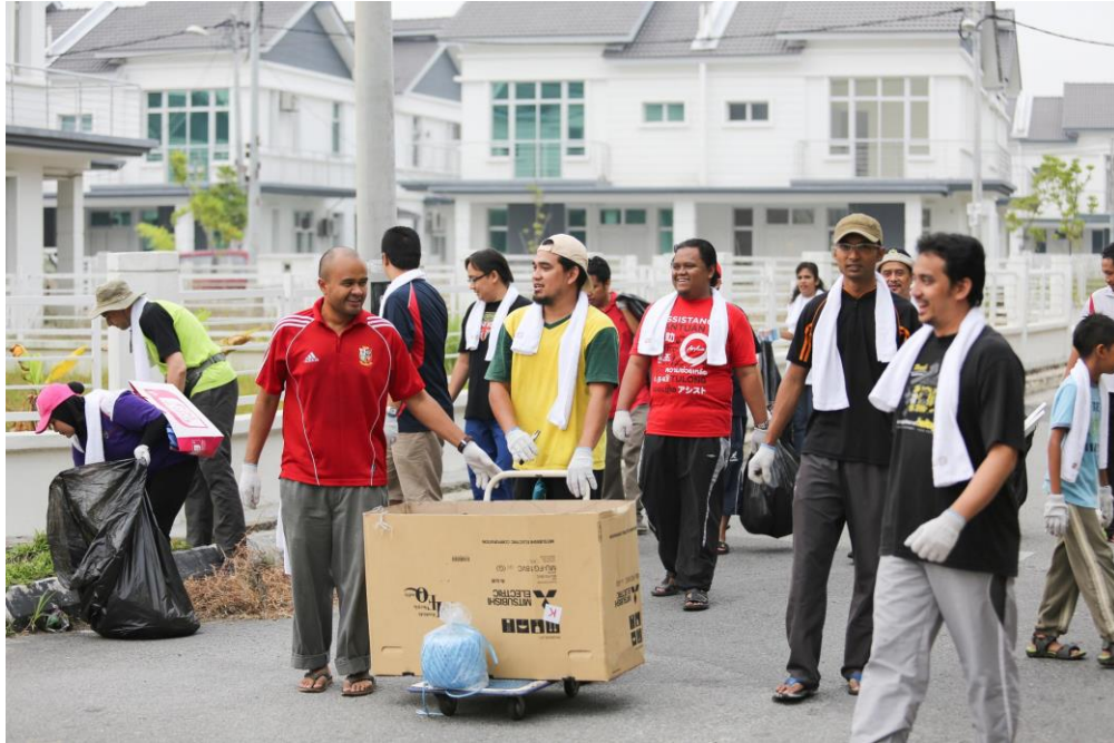
Penghuni Bandar Saujana Putra bersemangat membersihkan kawasan perumahan mereka.