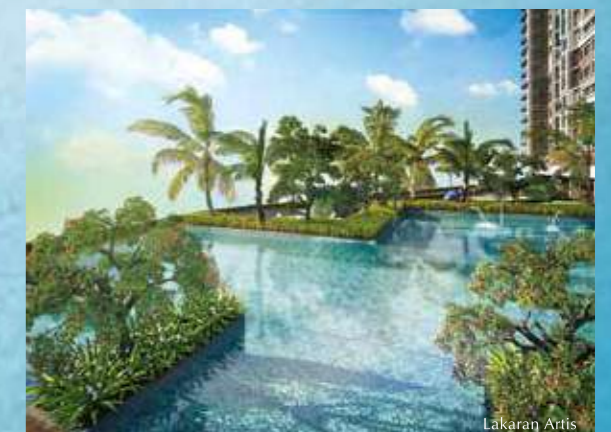
Segarkan diri di dalam kolam renang.