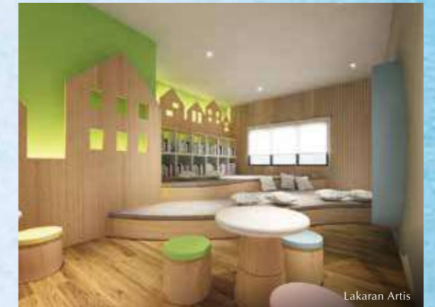
Temani diri dengan buku di bilik bacaan yang selesa.