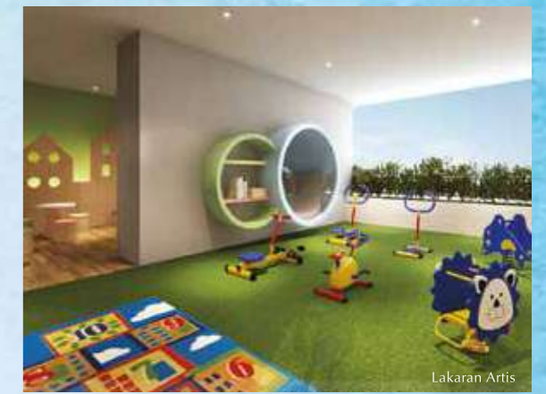
Biarkan si manja meneroka di gim kanak-kanak.