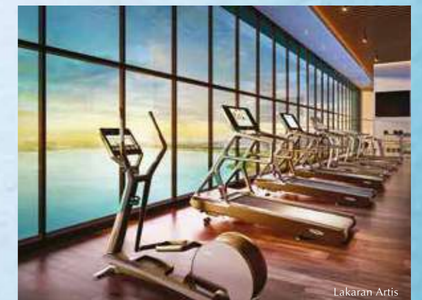
Aktifkan diri dengan kemudahan peralatan gim.