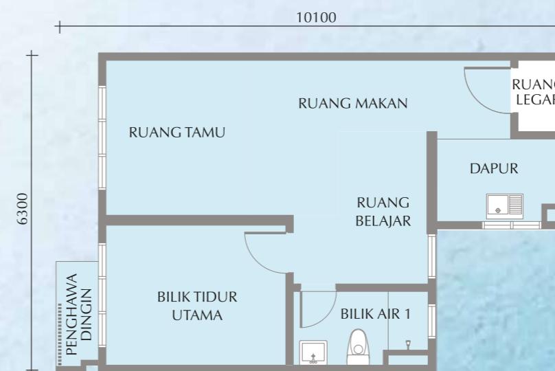
Jenis F • 554 Kaki Persegi