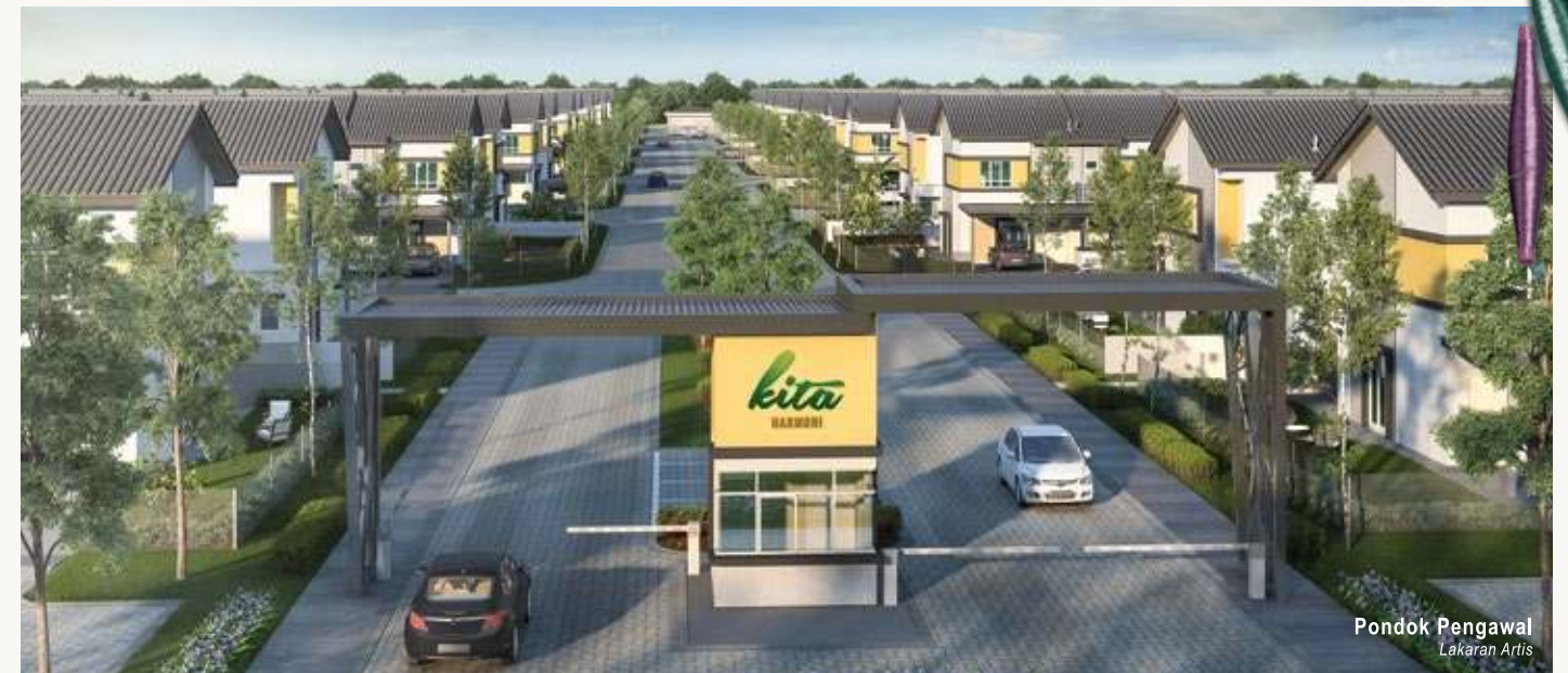
Pondok Pengawal Lakaran Artis