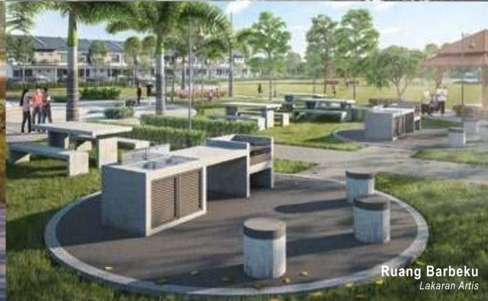
Ruang Barbeku Lakaran Artis