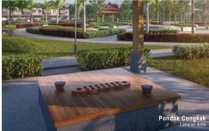
Pondok Congkak Lakaran Artis