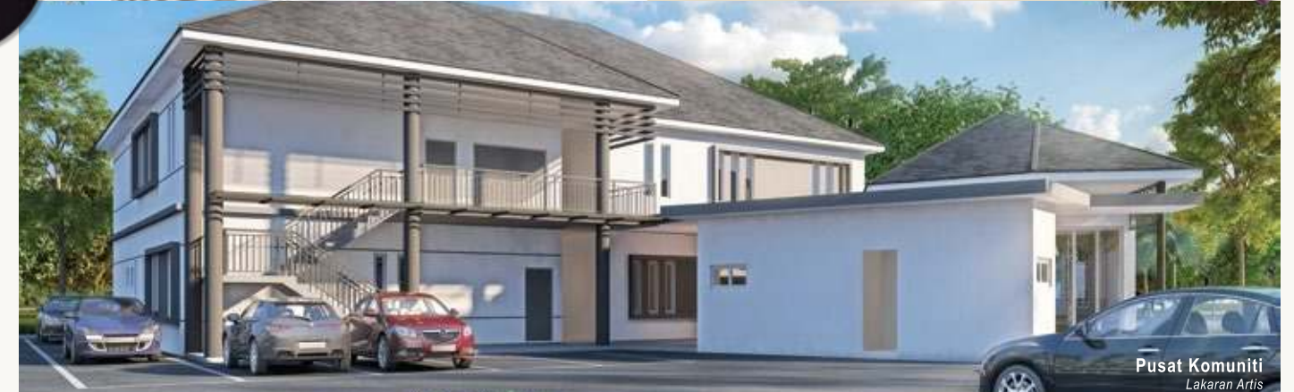
Pusat Komuniti Lakaran Artis