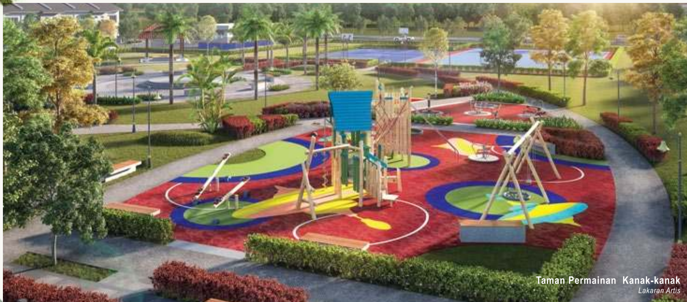
Taman Permainan Kanak-kanak Lakaran Artis